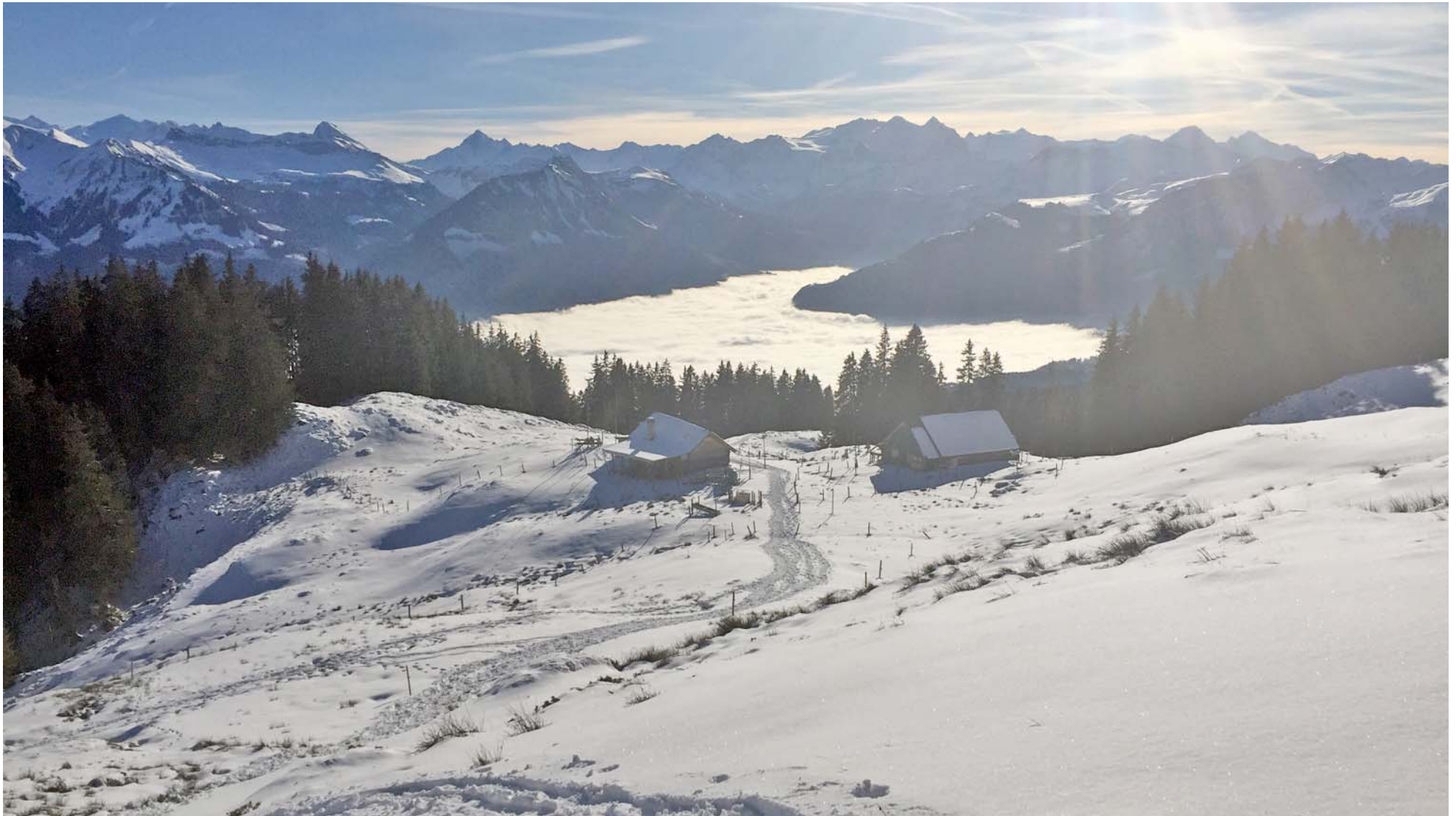
Abstieg in Richtung Wolfensmatt

Auch diesen schönen Ort müssen wir wieder verlassen: