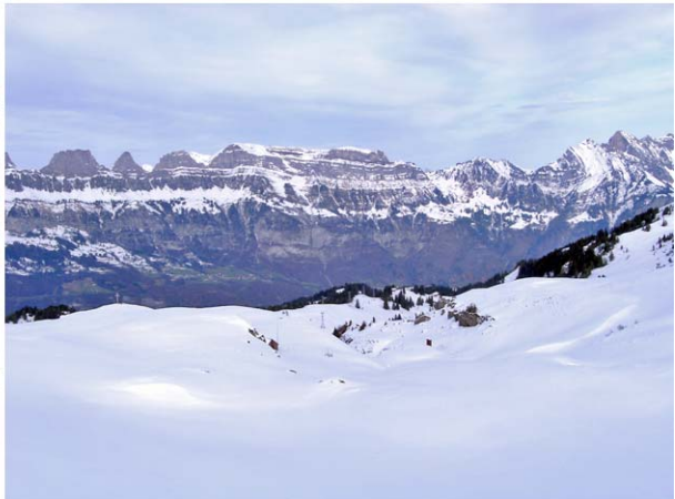
Foto unten links kurz vor der Ankunft bei der Maschgenlücke