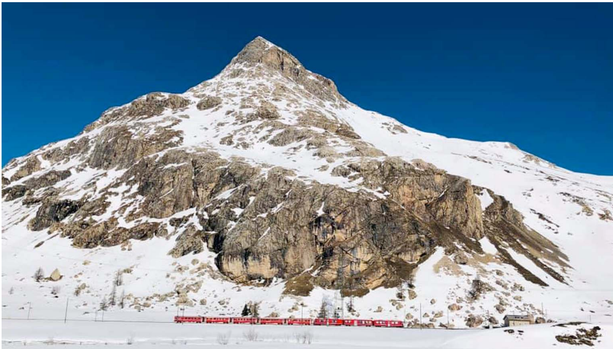
Auf der Höhe des Lago Blanco Staudamms