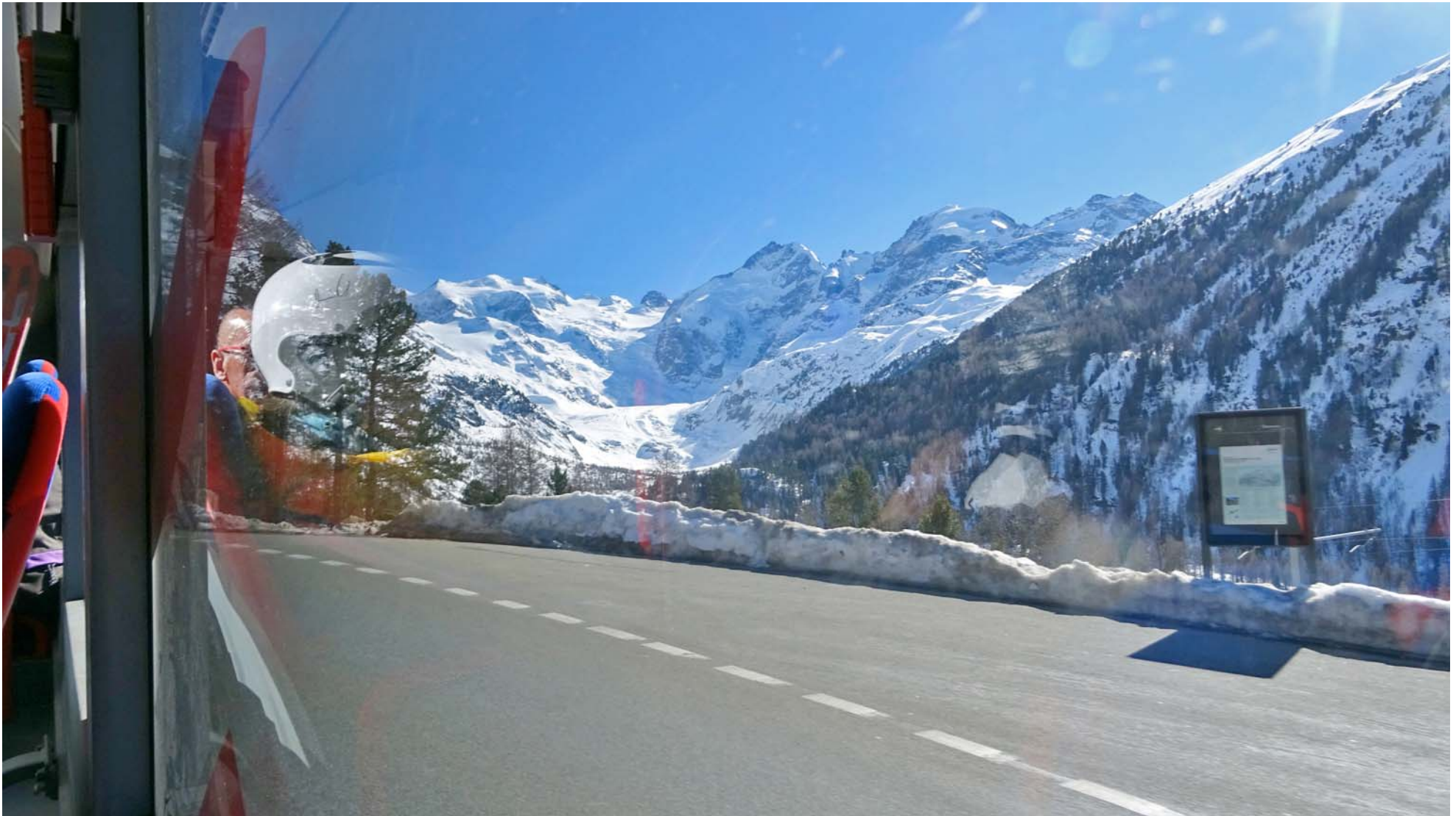
Durchblick zur Bernina-Kette oberhalb von Morteratsch

Von der Talstation der LSB Lagalp fahre ich mit dem Bus nach Pontresina: