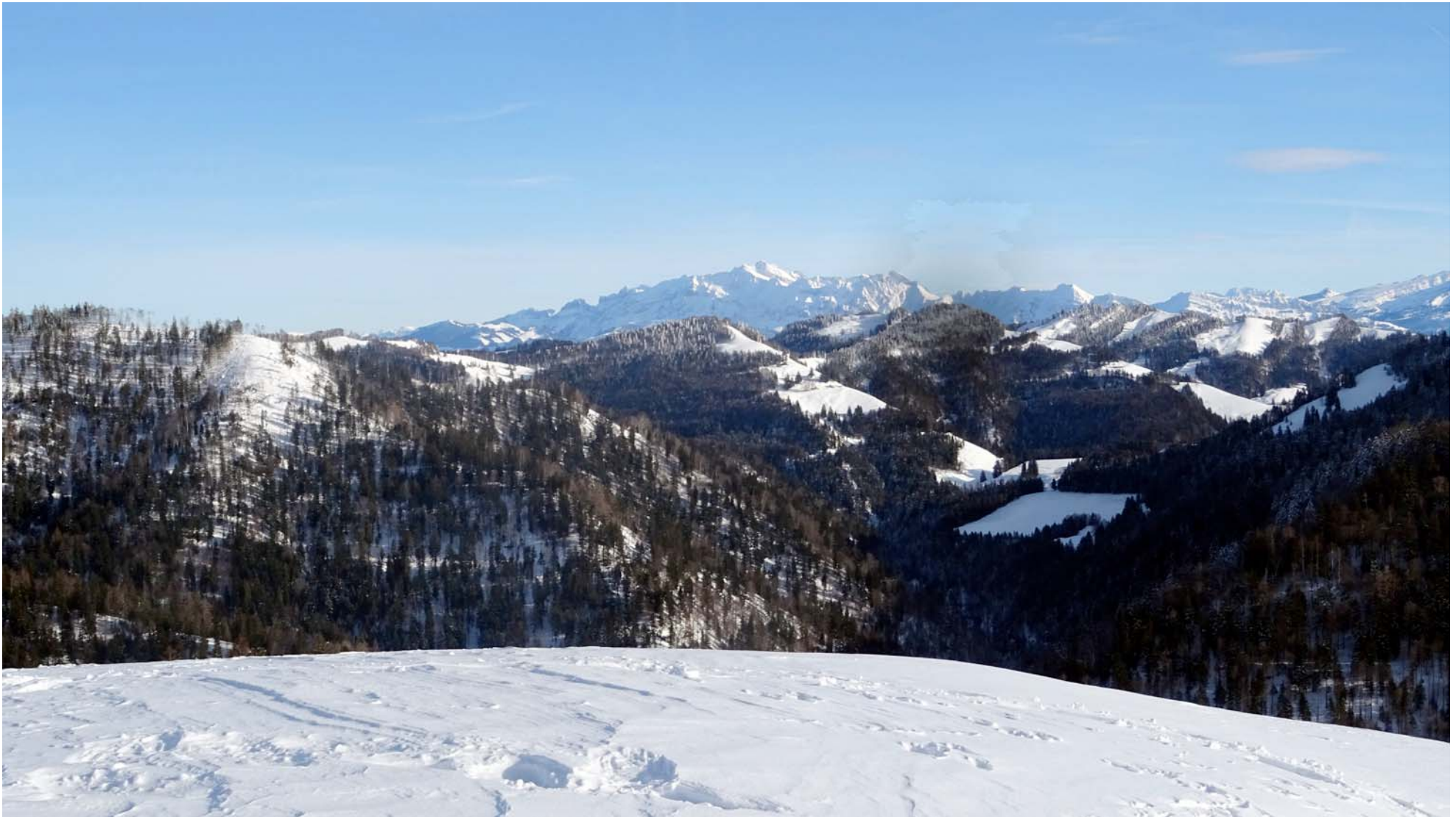
Der gezoomte Säntis