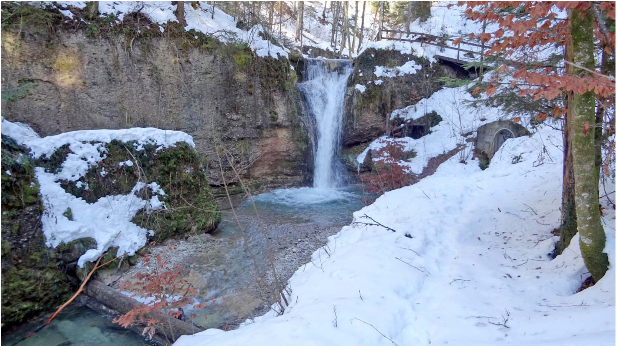
Schnee, Eis und Wasser im Sagenraintobel

Der grösste Wasserfall auf dieser Route kommt ganz am Anfang: