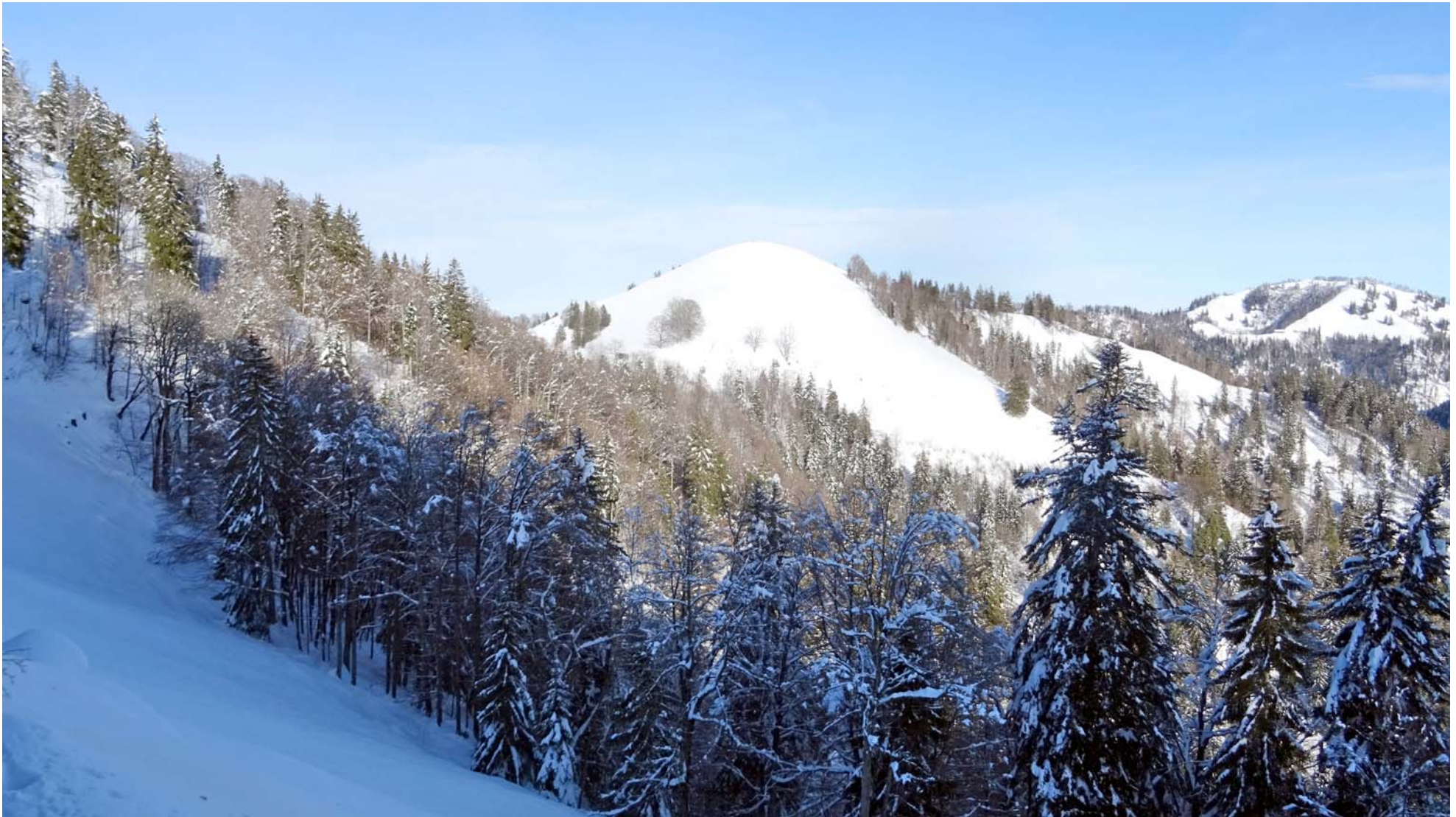
Mein Wanderziel: Der Glatzköpfige Aussichtsberg Hüttchopf

10 Minuten nach der Scheidegg sehe ich „es“: