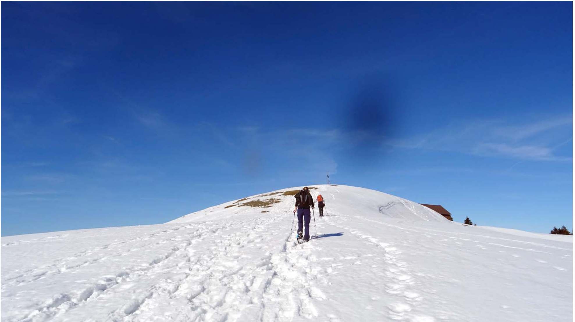
Gipfelsturm auf den Aussichtspunkt Hundwileren

Es folgt der letzte nennenswerte Aufstieg auf dieser Route: