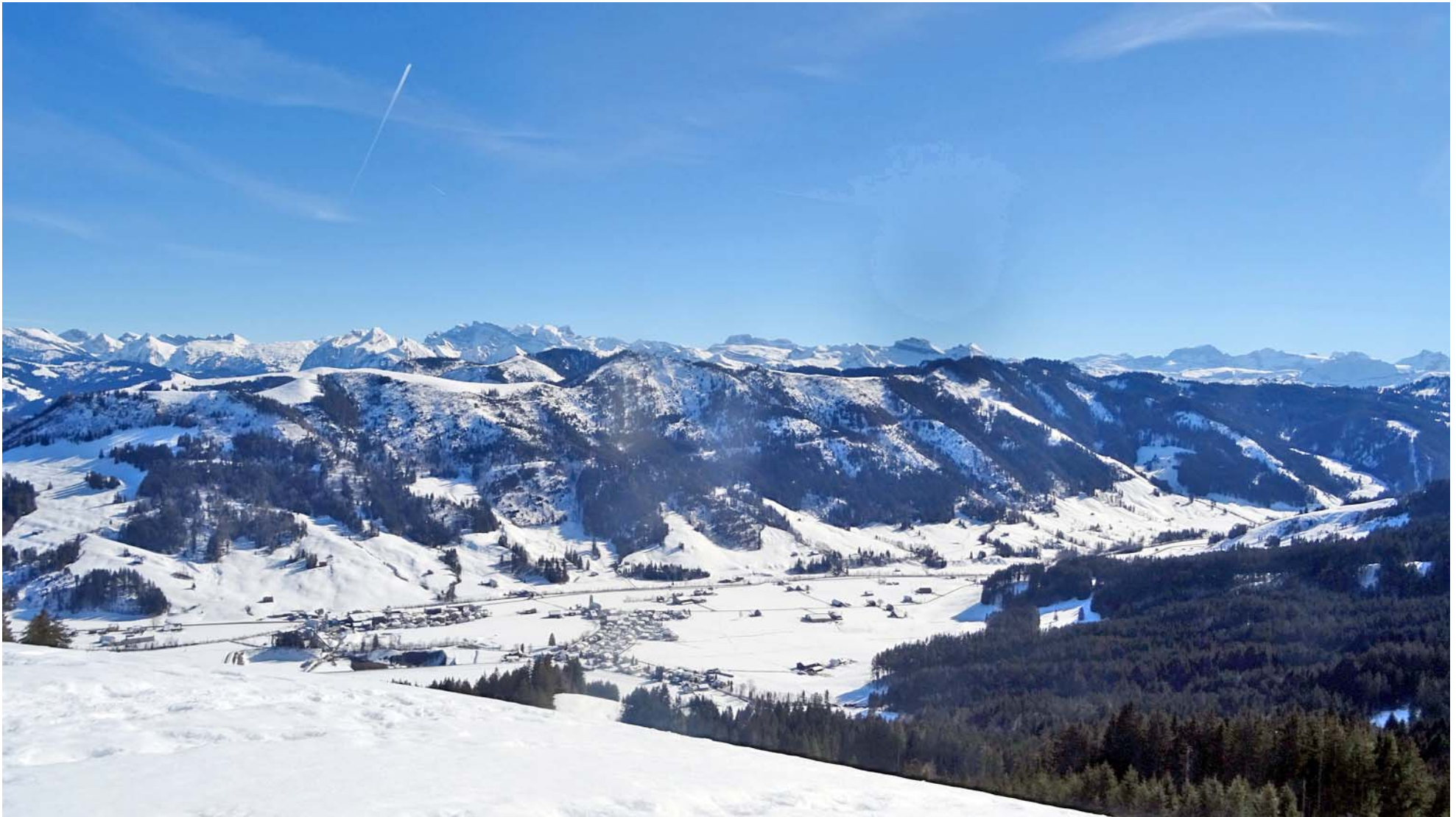
Die Innerschweizer Bergriesen über dem Alptal

Oben auf dem Ahoren ist die Aussicht schlicht wunderbar: