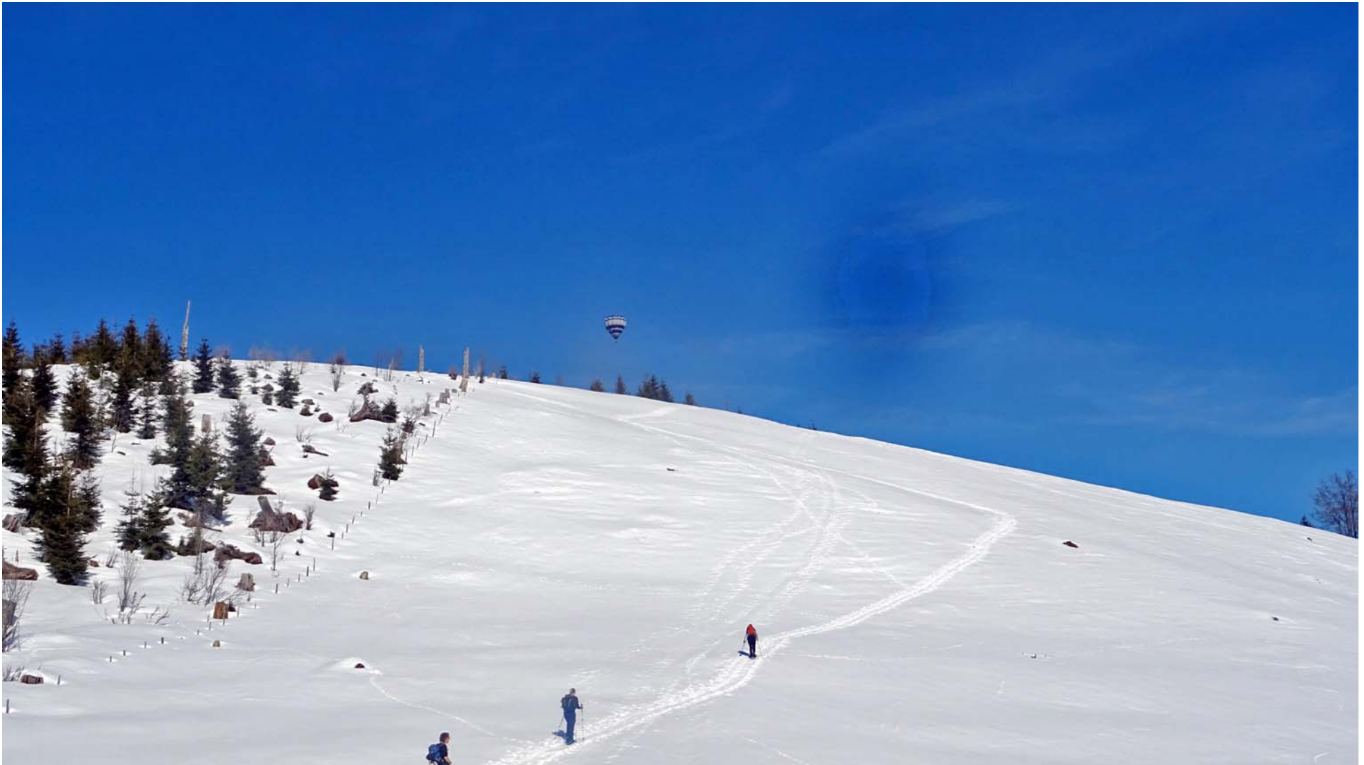
Den Glatzköpfigen Aussichtspunkt Ahoren

Einer der Ballon zeigt exakt unser erstes Etappenziel an: