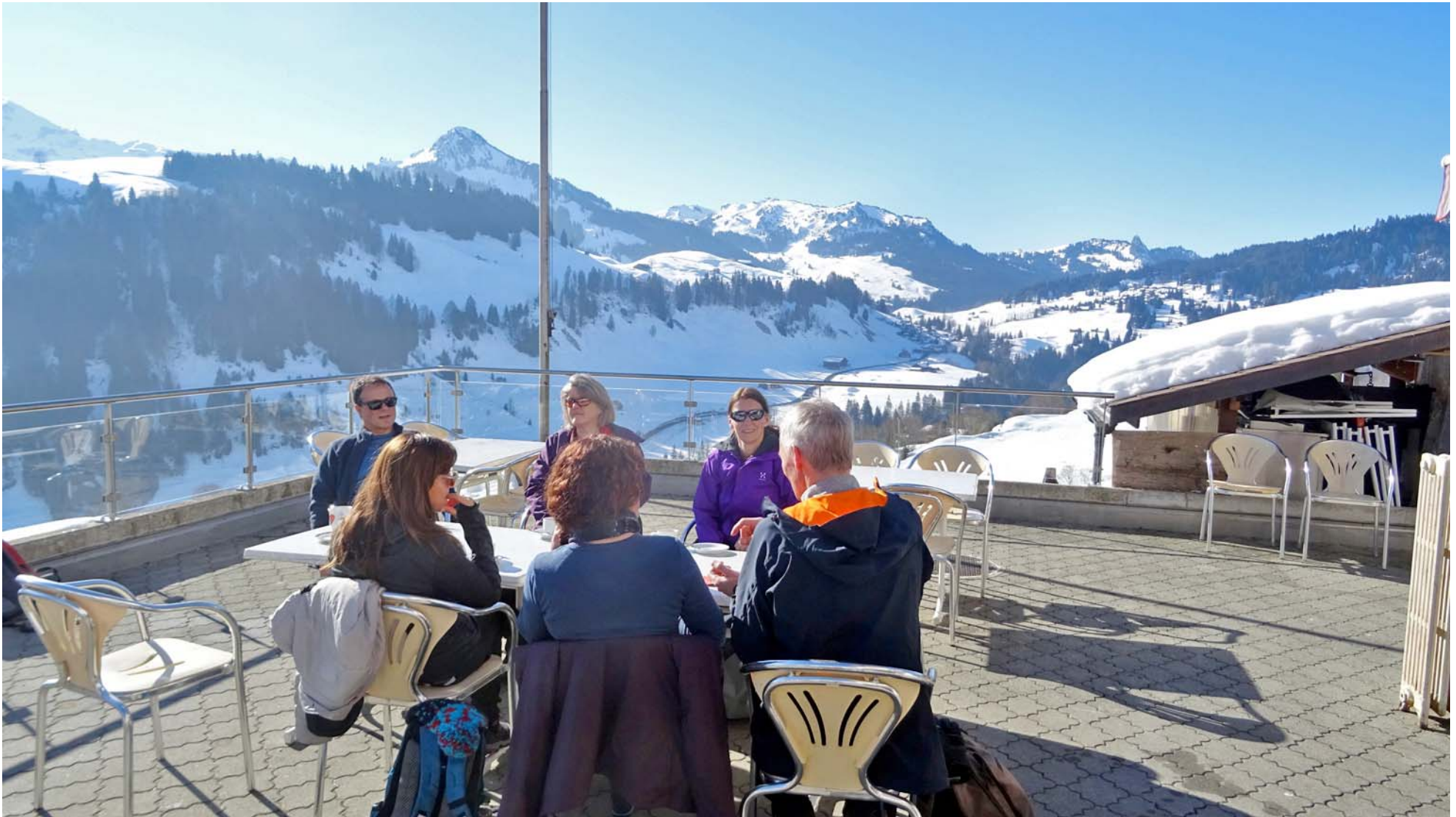
Start-Kaffee vor grandioser Kulisse

Nach 30 Minuten resp. 170 Höhenmeter ein Boxenhalt in Bergrestaurant Höch Gütsch: