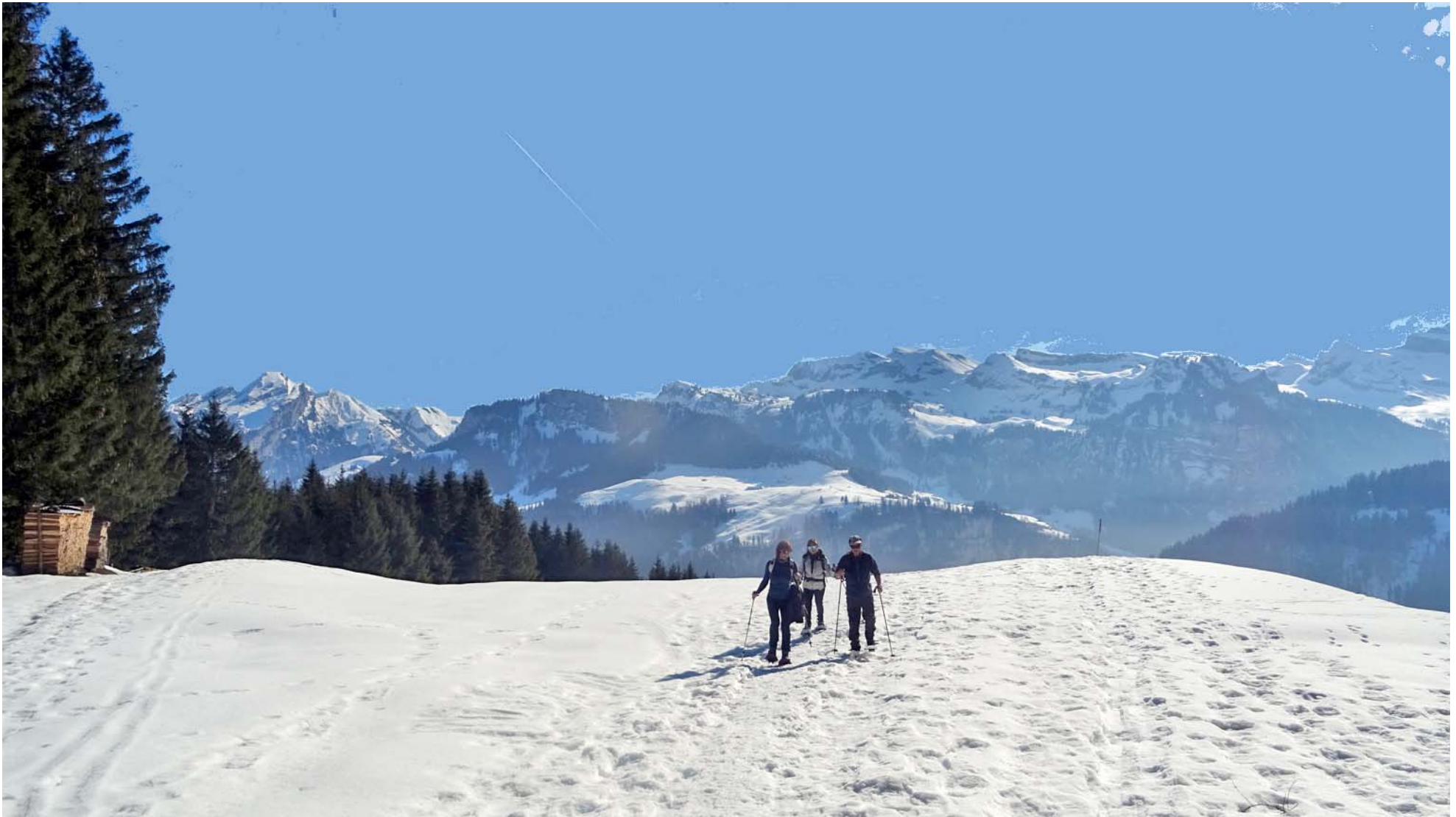
Promenade vor dem Glärnisch dem Diethelm