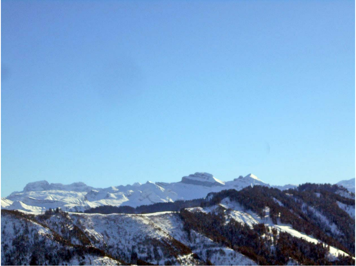
Der Drusberg in der Mitte, rechts der Forsberg und links Bös Fülen, davor die Silbernen