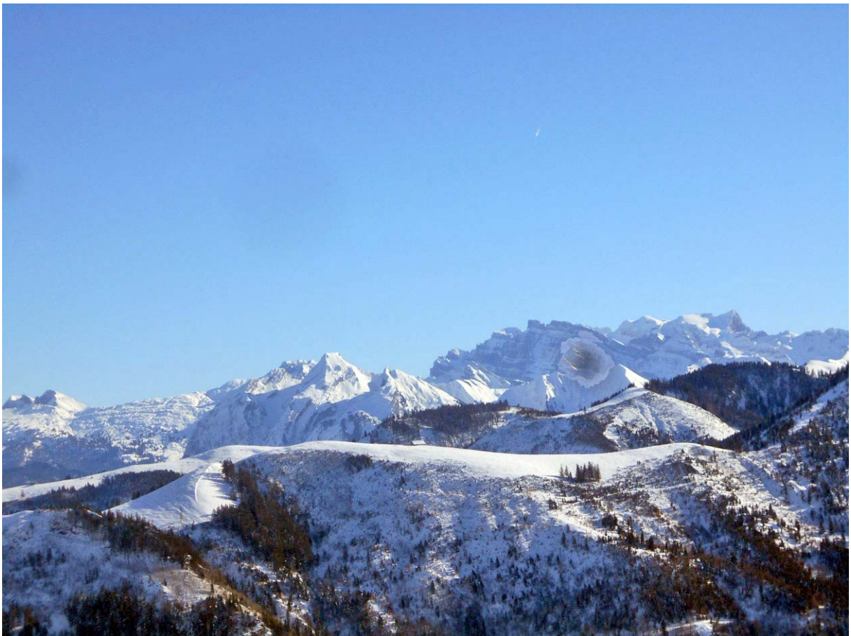
Das Glärnsich-Massiv, davor der Bergrücken auf der rechten Alptalseite