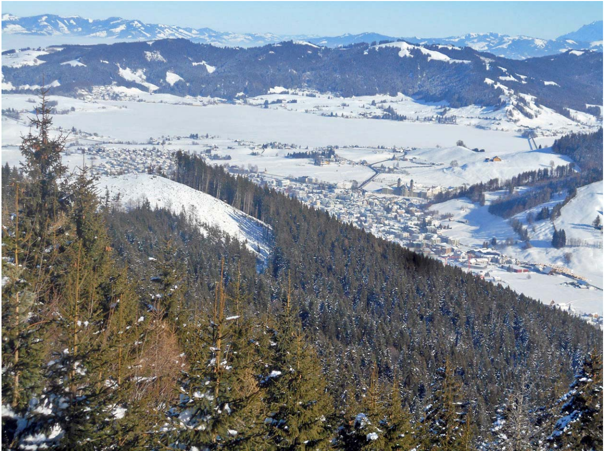
Blick auf Einsiedeln, dahinter der zugefrorene Sihlsee

Kurz nach der Samstageren ein Zwischen-Stopp an einem nächsten Aussichtspunkt: