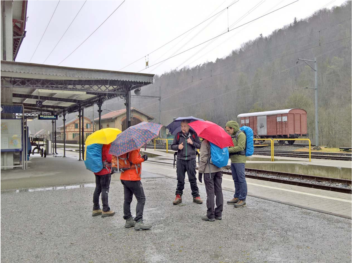
Das obligate Briefing vor dem Start beim Bahnhof Sihlwald

Nach der „Warmlauf-Schleife bis Sihlbrugg Dorf: