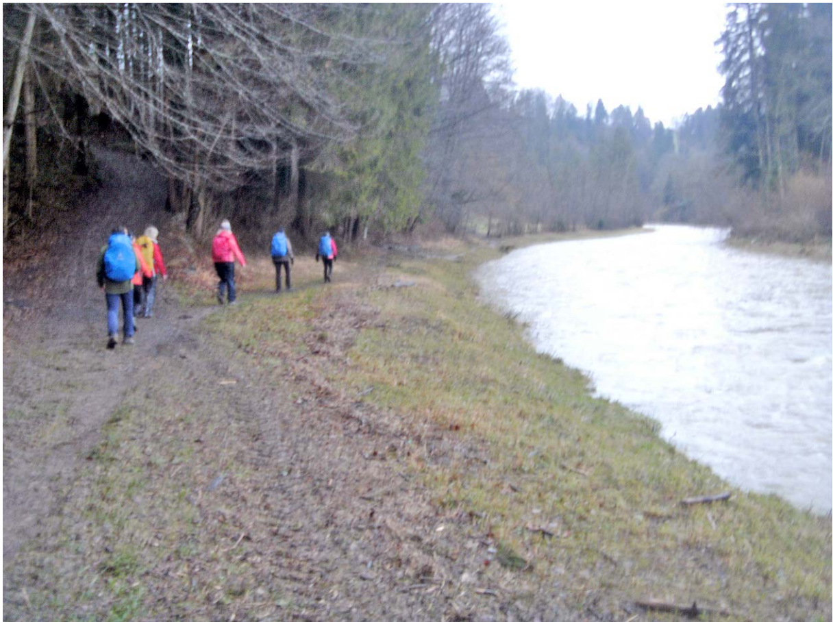
Der Term „Uferwanderung“ wird seinem Namen gerecht

Nach der „Warmlauf-Schleife bis Sihlbrugg Dorf: