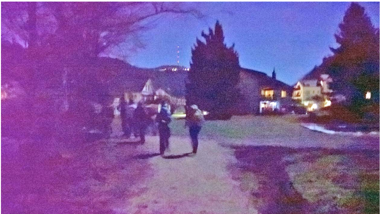
In der Bildmitte oben der Uetliberg Kulm

Bei Sellenbüren verlassen wir die Reppisch und wechseln auf die andere Talseite