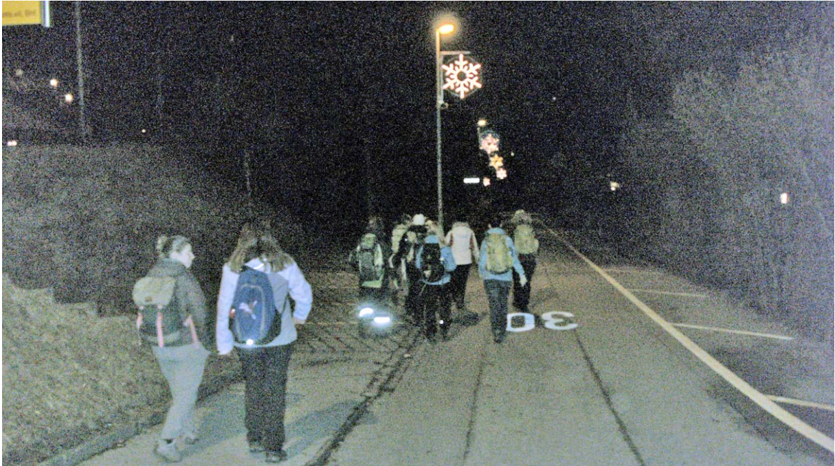
Abstieg in weihnachtlicher Aura zur Reppisch

Kurz nach 21:30 Uhr starten wir vom Bahnhof Birmensdorf