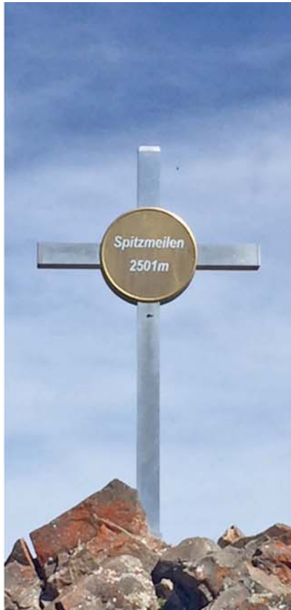
Foto Gipfelkreuz