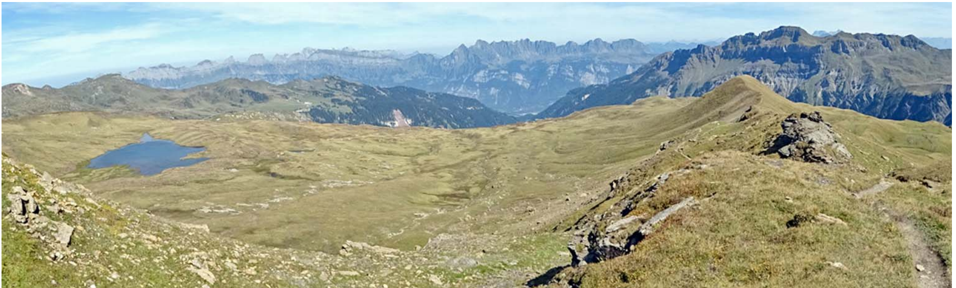
Blick gegen Südosten