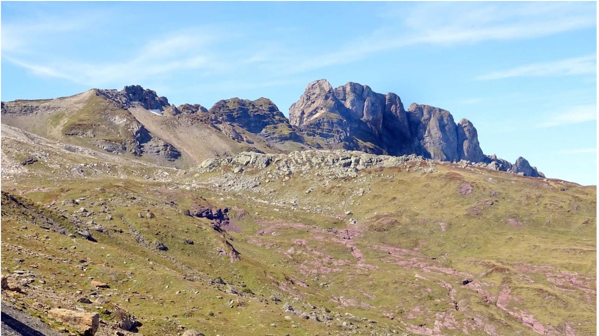
Der dominante Hügelzug links vom Maschgenkamm