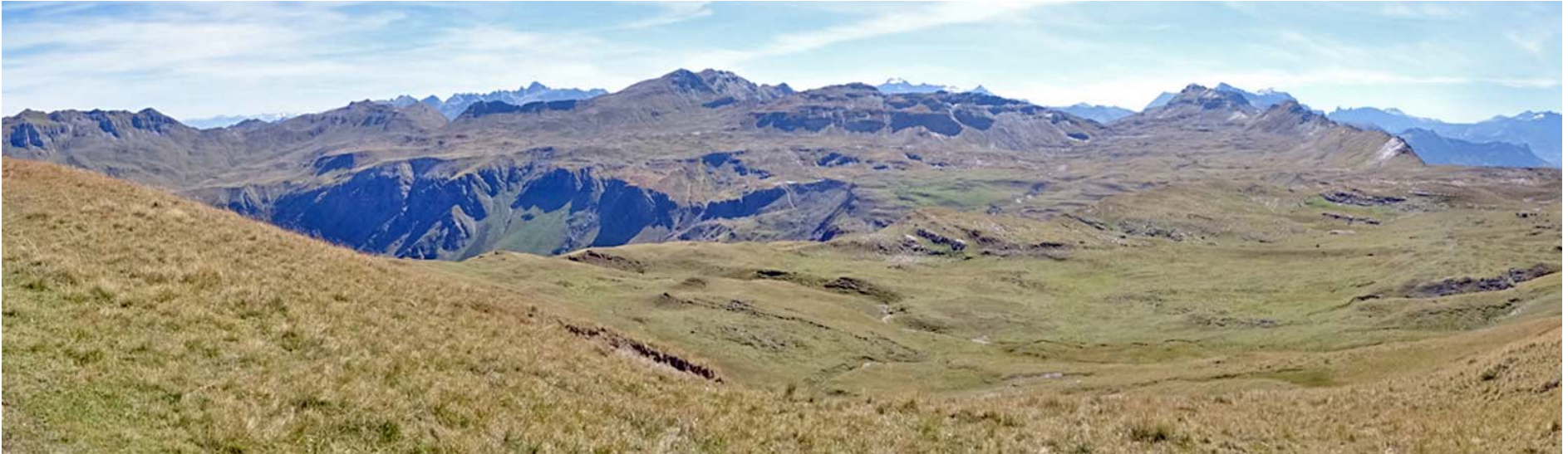
Blick gegen Süden