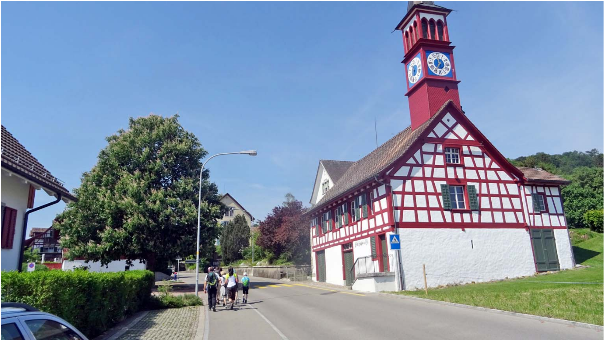
Stellvertretend das alte Schulhaus in Neerach

Das Zürcher Unterland ist ein Eldorado für die Fans von Fachwerk-Häusern: