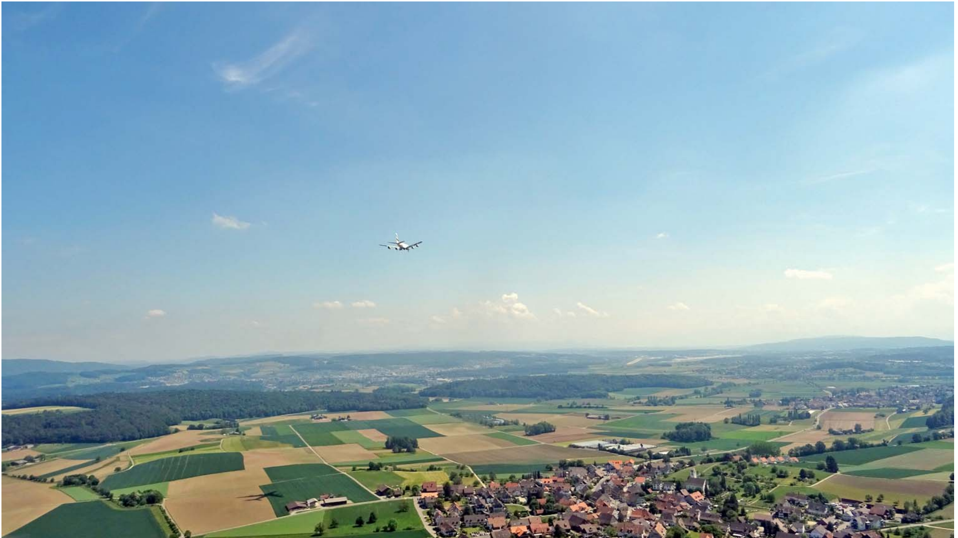
Geruhvoller Anflug auf Zürich Kloten

Die A380 ist erstaunlich leise und fliegt vergleichsweise langsam: