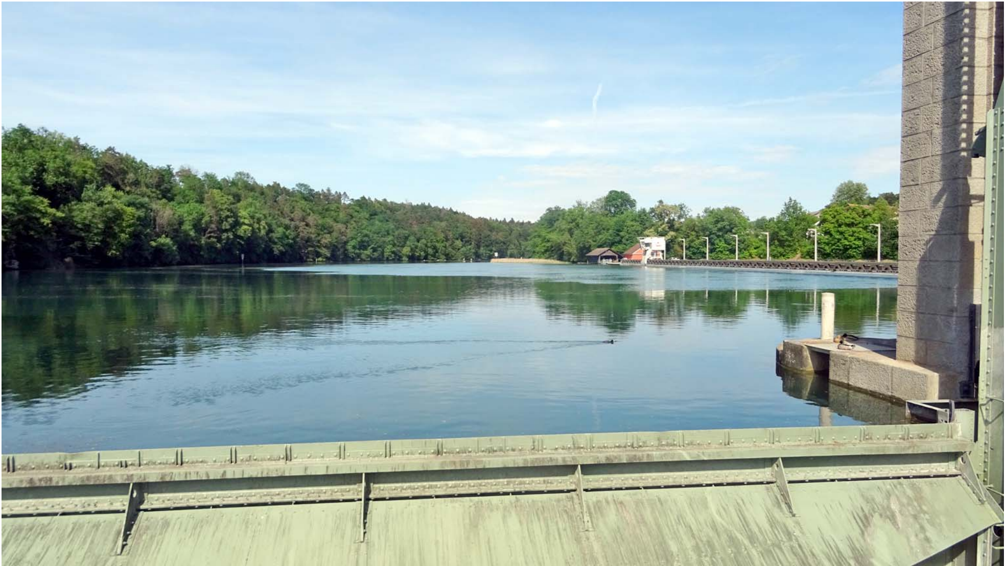
Blick Rheinaufwärts über eines der 6 Wehre

Die Zeit reicht noch für einen Kurz-Besuch in Deutschland: