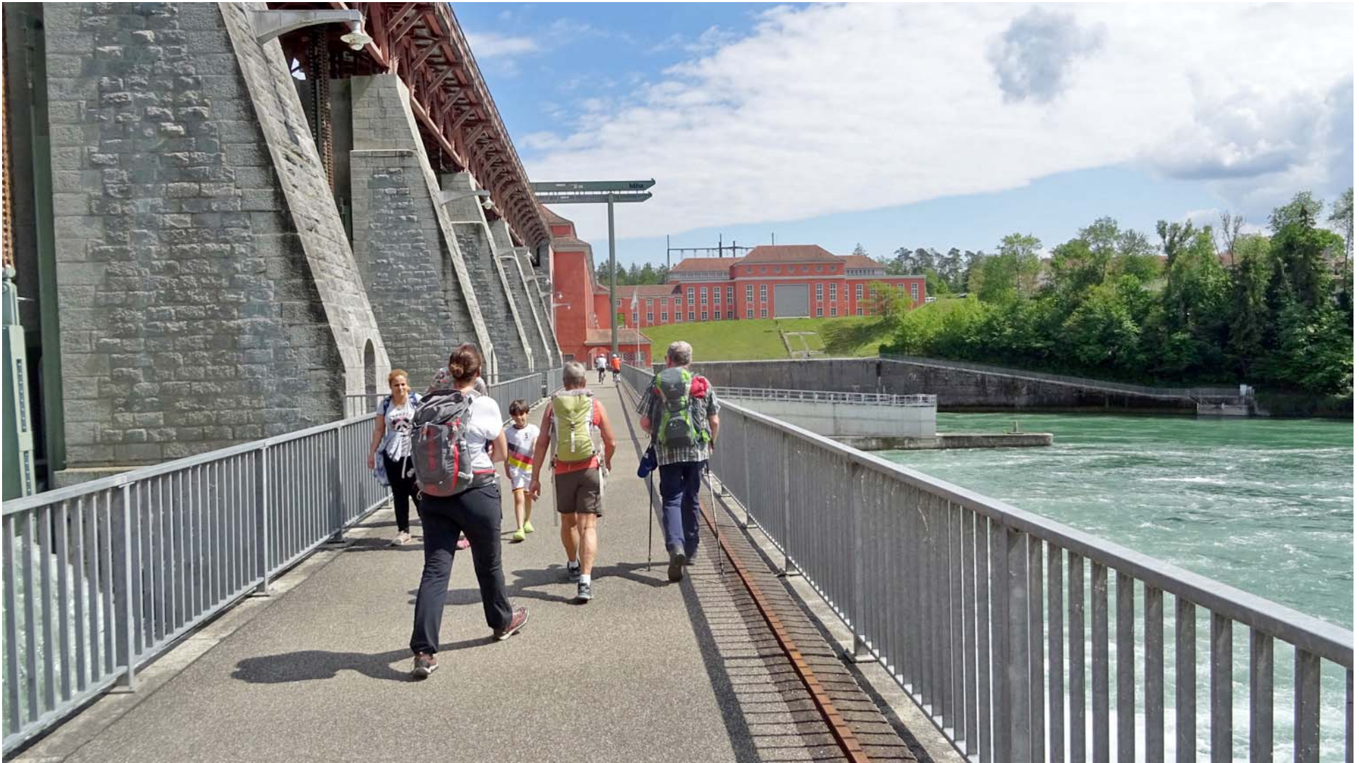
Eilmarsch in Richtung Beiz ;-)