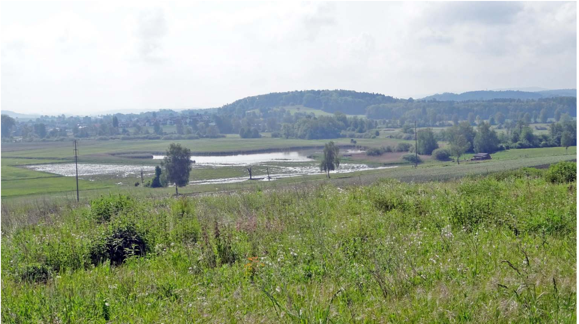
Das überregional bekannte Neeracher Ried