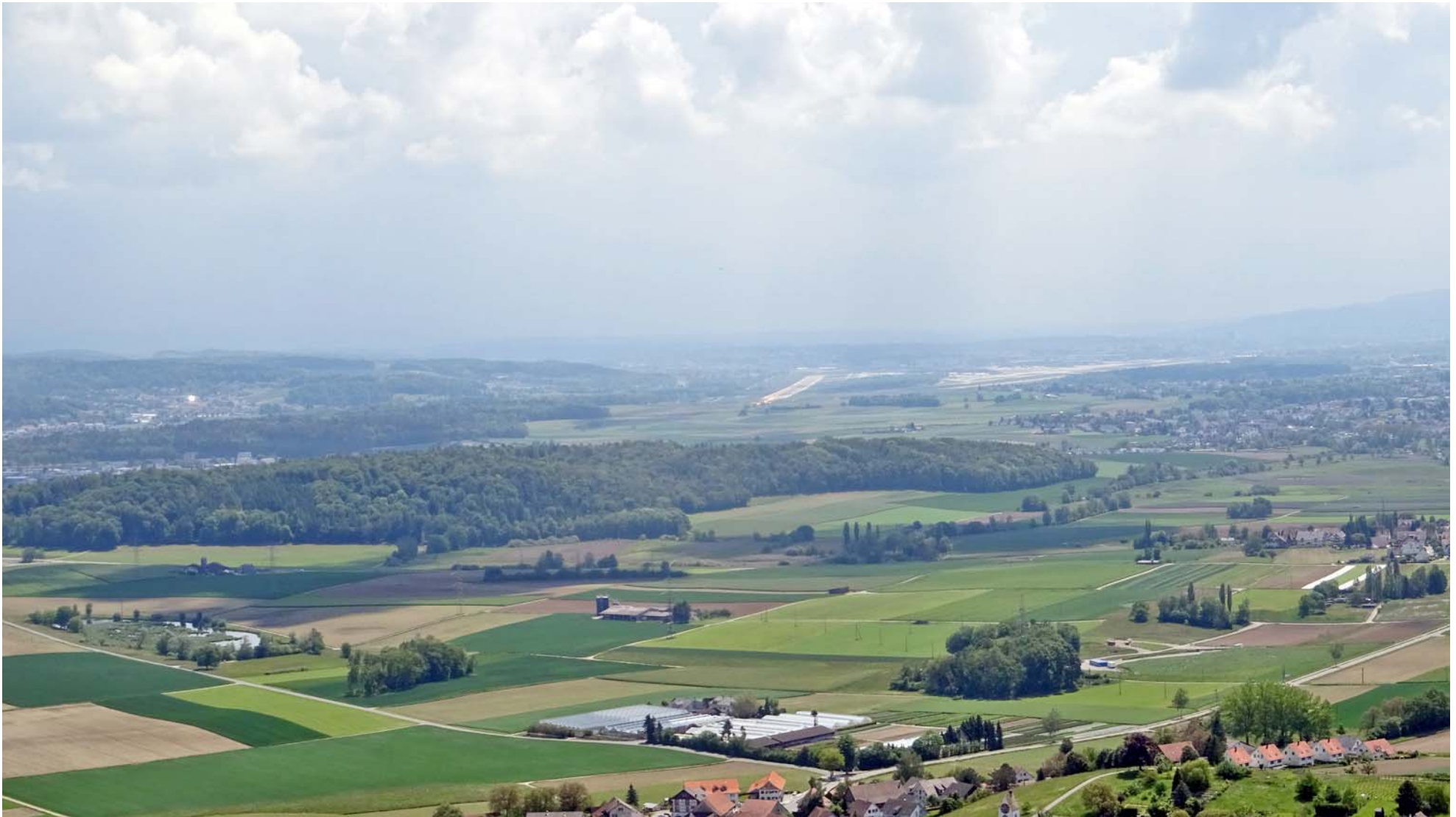
In der Bildmitte die legendäre Piste 6