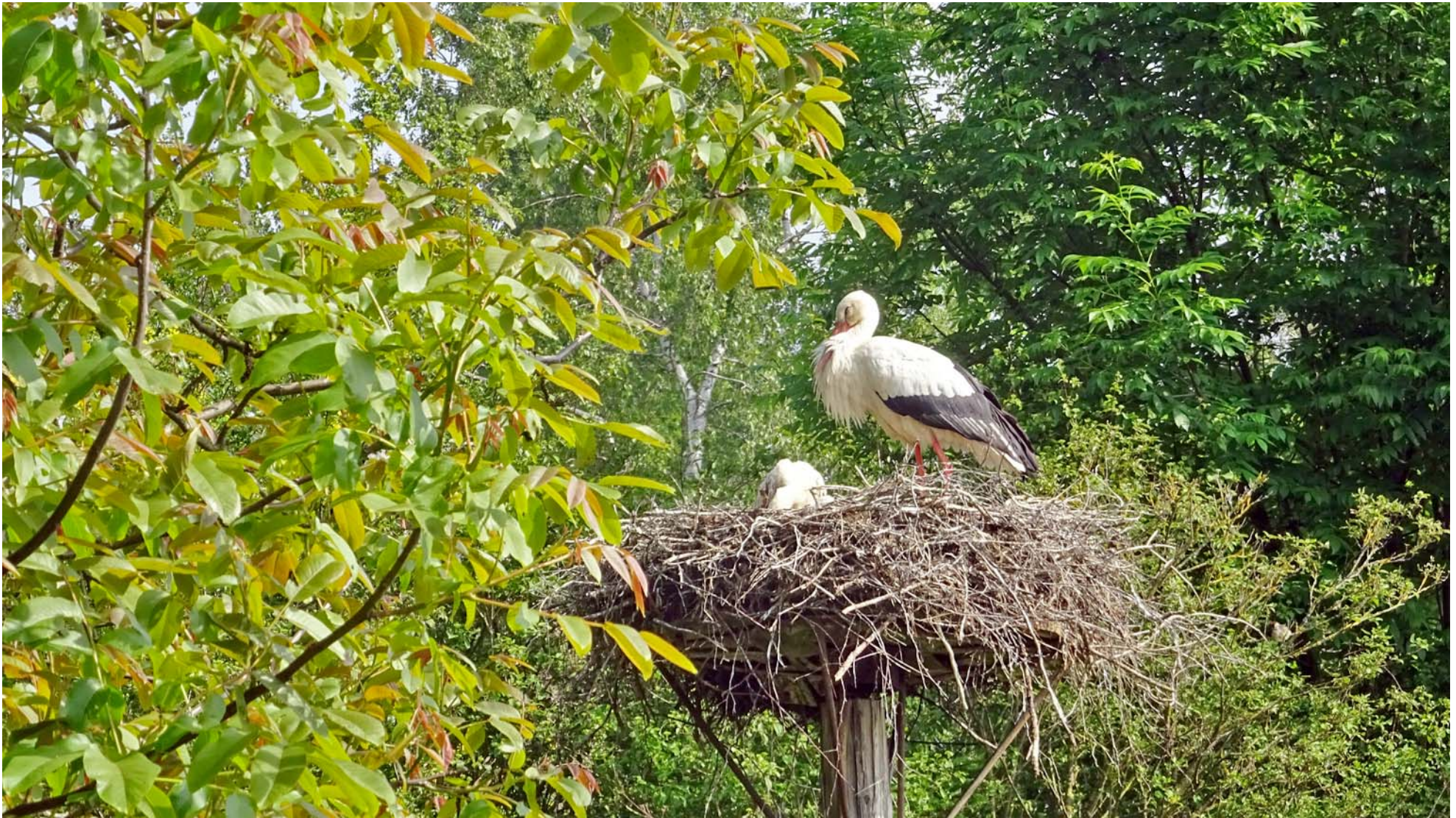
Der Nachwuchs schaut bereits über den Nestrand

20 Minuten nach dem Start beim Bahnhof Steinmaur erreichen wir die gleichnamige Storchen-Kolonie: