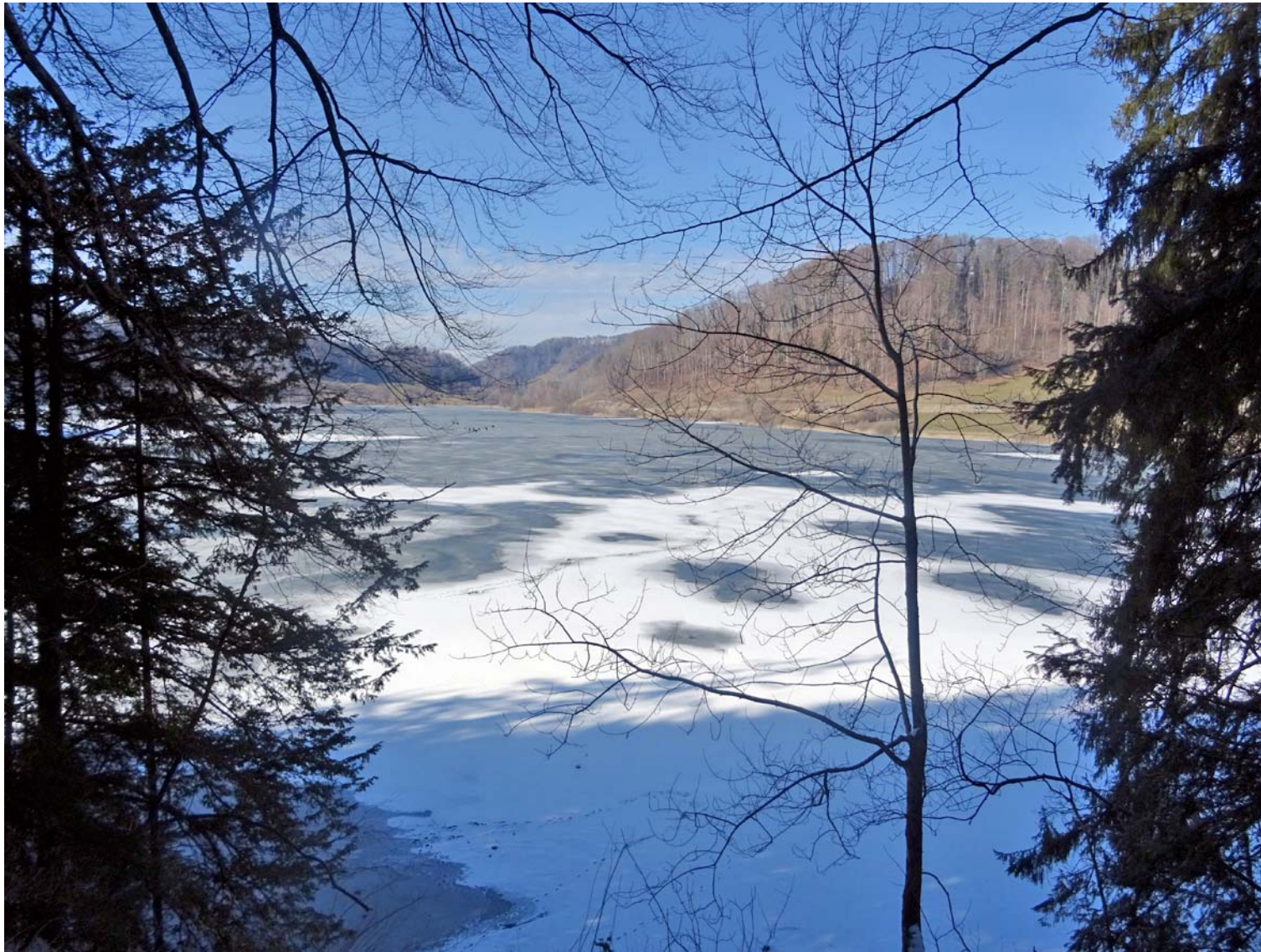
Blick durch eine Waldlücke von erhöhter Lage