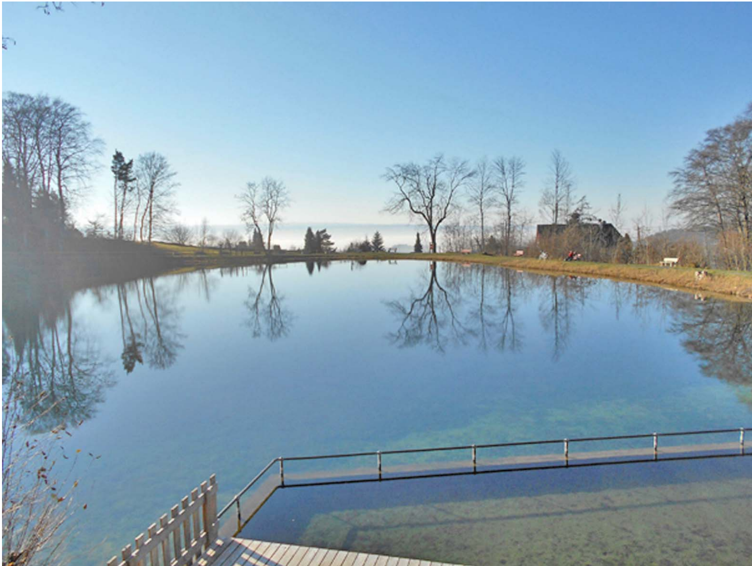
Der Hedinger Badeweiher, erhöht über dem östlichen Dorfrand

Schon nach 15 Minuten das erste Highlight auf dieser Route: