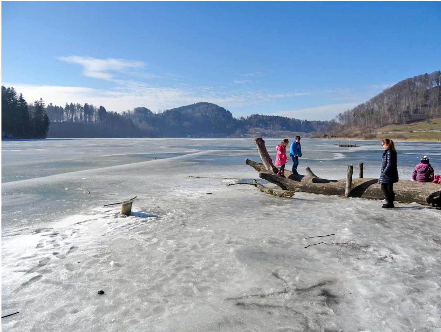
Blick vom Südufer über das pickelharte Wasser in Richtung Aeugsterberg

Auch beim legendären Baumstrunk herrscht Full House :