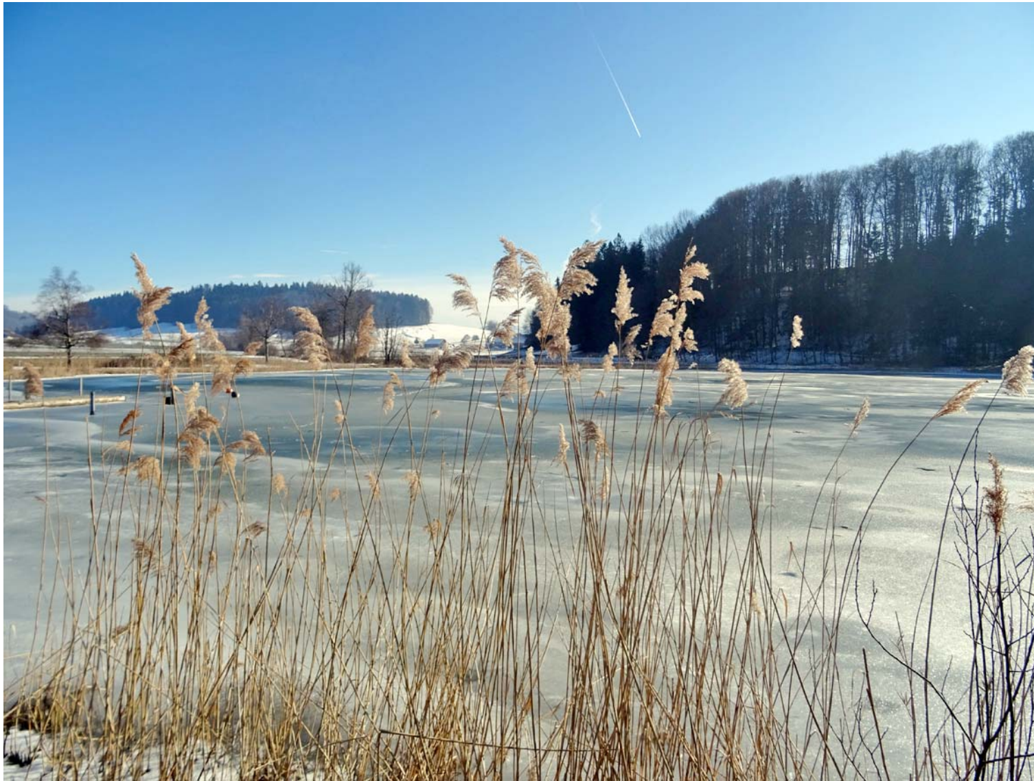
Idyllische Perspektive in Richtung Vollenweid und bewaldetes Westufer