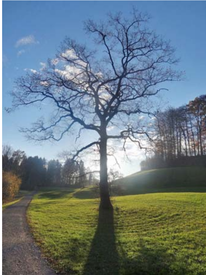
Einer meiner Lieblingsbäume, aufgenommen im Gegenlicht.

Auf dem Rückweg zum Hexengraben nochmals eine Herbstimpression: