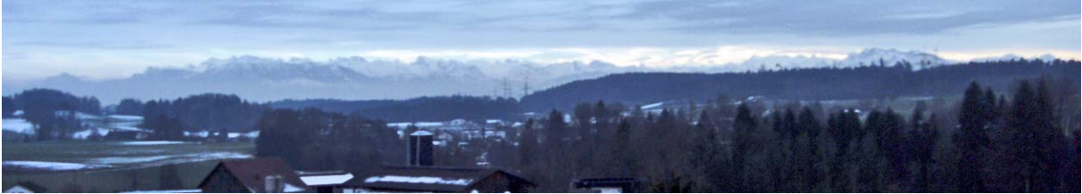
Alpensicht aus der Sälenwald-Perspektive.

Fazit dieses Spaziergangs: Die etwas verbrauchte Floskel „ Was willst du denn in der Ferne, das Gute liegt so nah “ kommt bei dieser Route voll zum Zug: Das untere Jonental bietet zu jeder Jahreszeit schöne Impressionen und kann auch ganzjährig begangen werden. Wer den Spaziergang zu einer Genusswanderung mutieren möchte, findet unterwegs eine Vielzahl von Grillstellen und kann die Route mit Besuchen der Ruine einer römischen Villa und der Bohlenständer-Siedlung Ismatt ergänzen, siehe den Blog von Oktober 2014 .