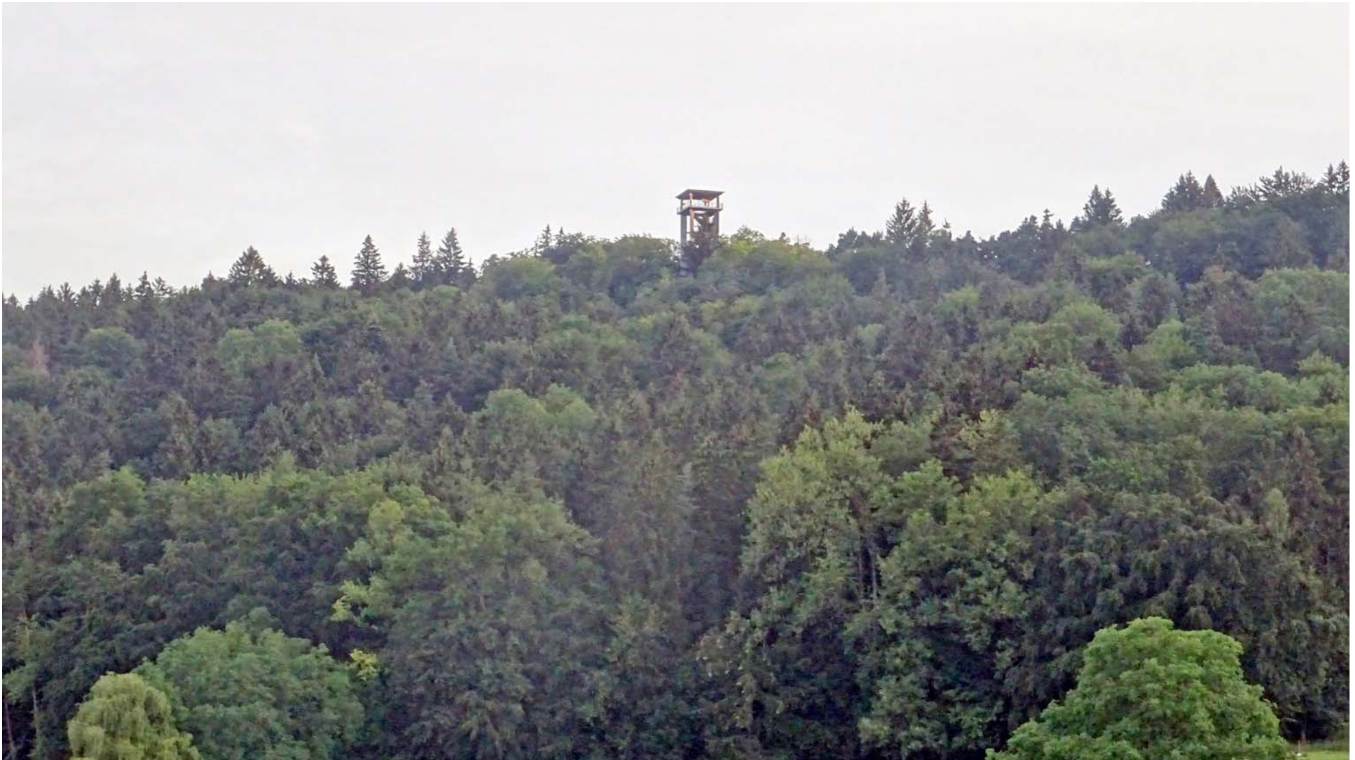
Der Aussichtsturm auf dem Altberg, gezoomt aufgenommen