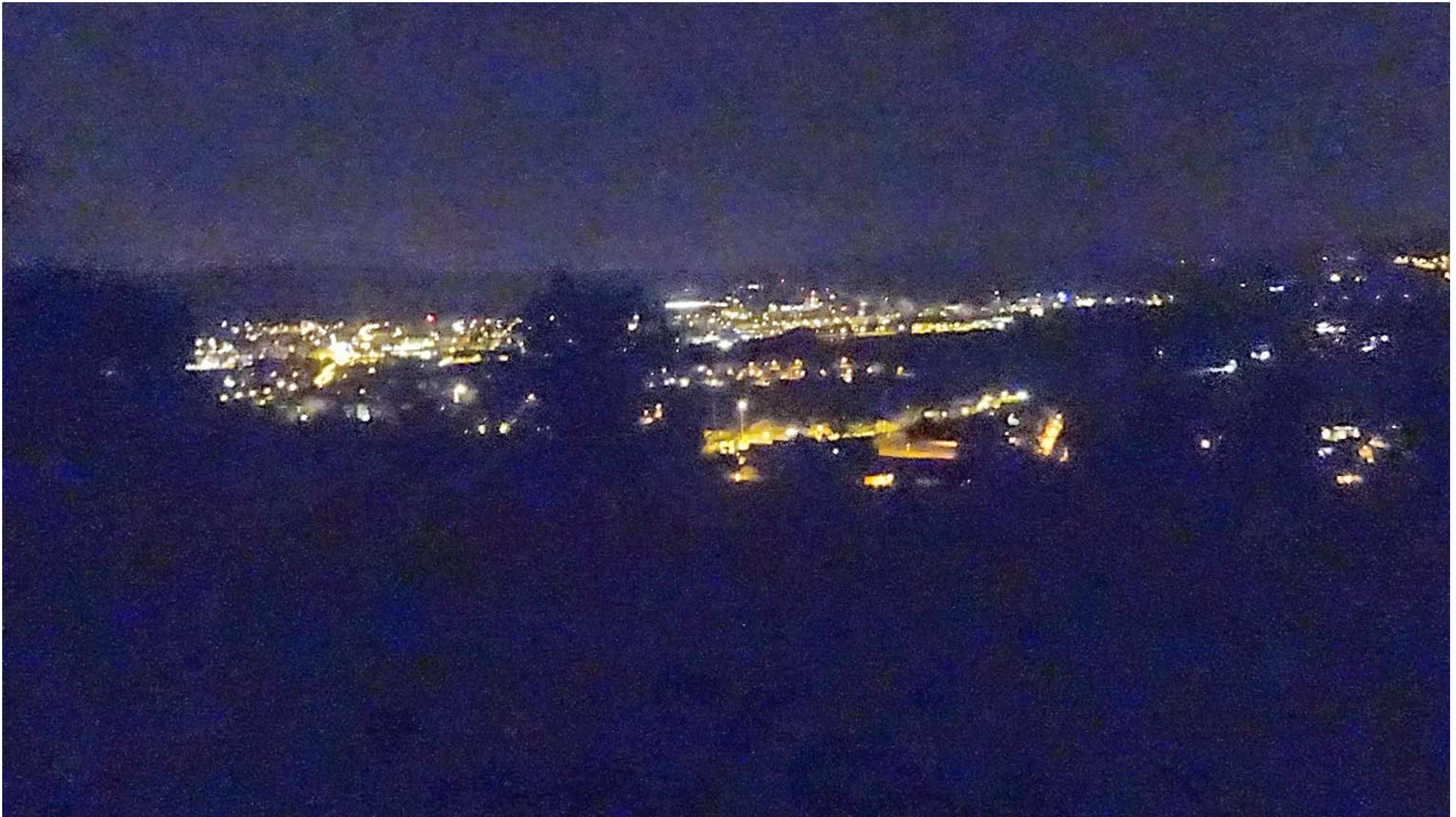
Tiefblick auf Weiningen nach dem Wald-Austritt

Gut genährt und gelaunt nehmen wir den Rest der Altberg-Aufstiegs-Route in Angriff: