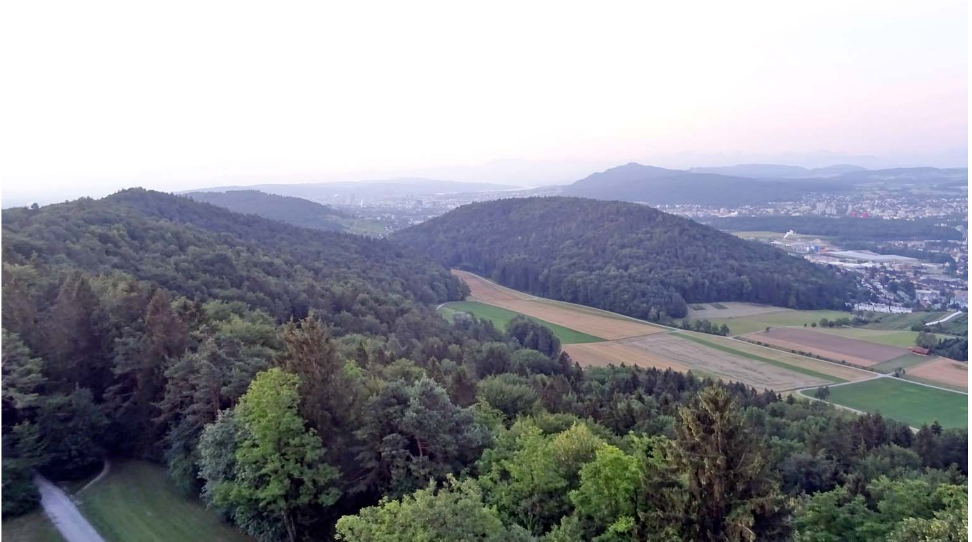
Blick zurück auf Zürich (Bildmitte links), rechts daneben der Uetliberg

Es wird bereits allmählich hell, als wir den Aussichtsturm auf dem Altberg besteigen: