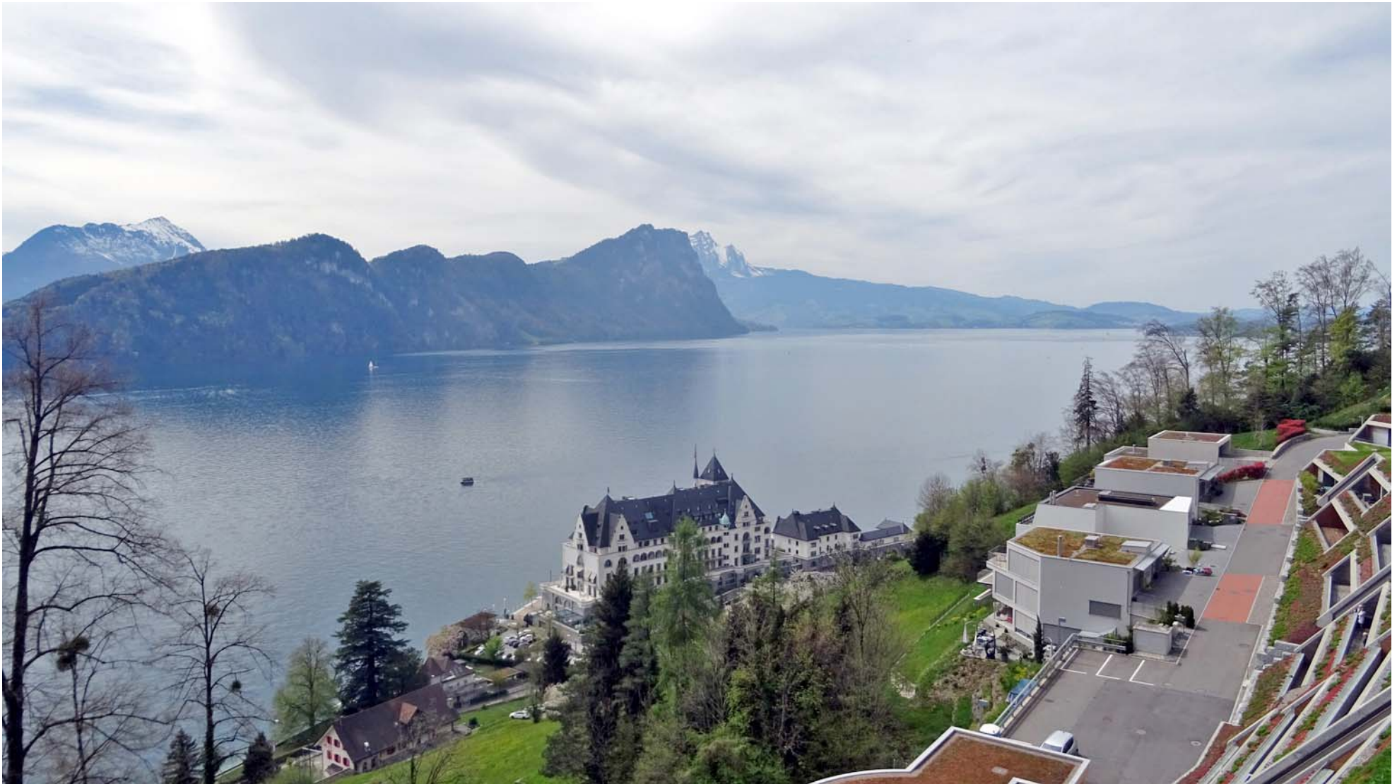
Unten am Seeufer das kürzlich renovierte Parkhotel

Wir durchqueren Vitznau und nehmen den heute strengsten Aufstieg unter die Füße: