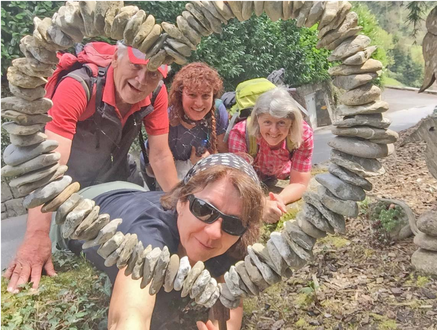
Schon mal etwas von einem „herzlichen Selfie“ gehört? ;-)