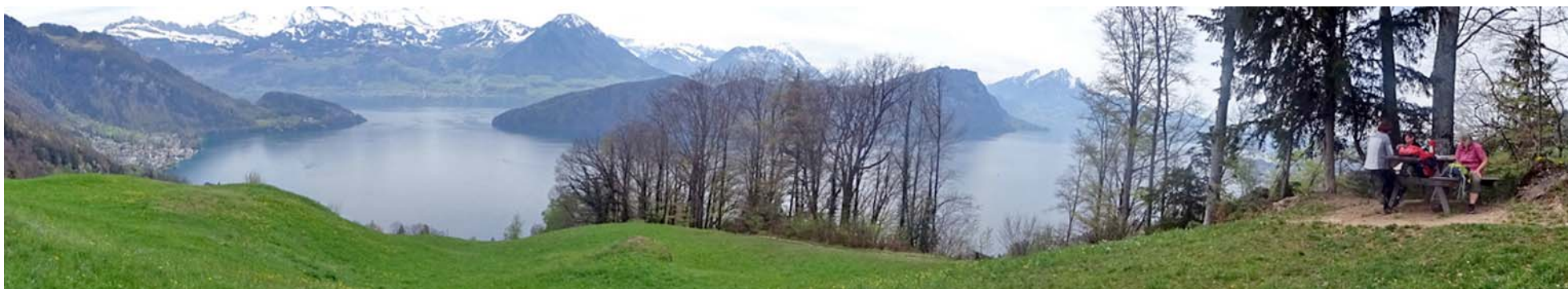
Vom höchsten Punkt der Etappe Vitznau – Weggis