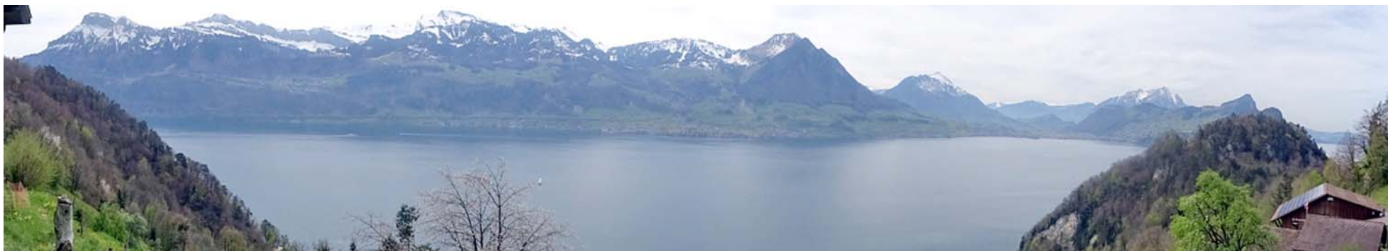
Vom höchsten Punkt der Etappe Gersau – Vitznau