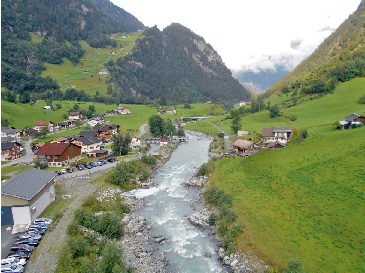
Blick aus der LSV-Golzern auf unseren Startort Bristen

Dieser Blog kommt ohne schöne Bergwelt-Bilder aus, weil die Weitblicke praktisch konstant durch die Wolkendecken beeinträchtigt wurden. Wer schöne Bergbilder aus dem Maderanertal ansehen möchte, schaut sich den Blog meiner REKO-Tour im Juni 2017 an.