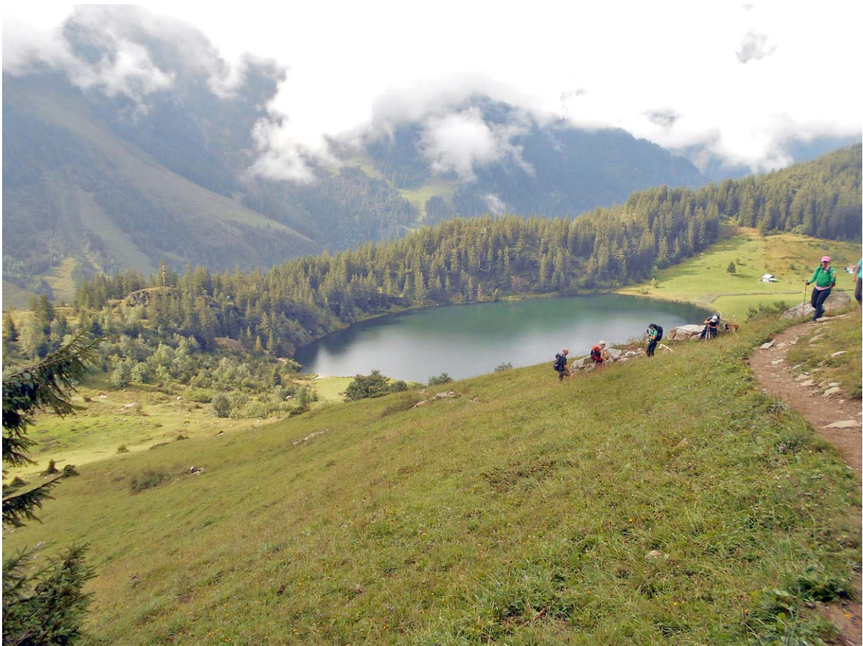
Von Golzern steigen wir auf in Richtung Windgällenhütte: Tiefblick auf den idyllischen Golzernsee