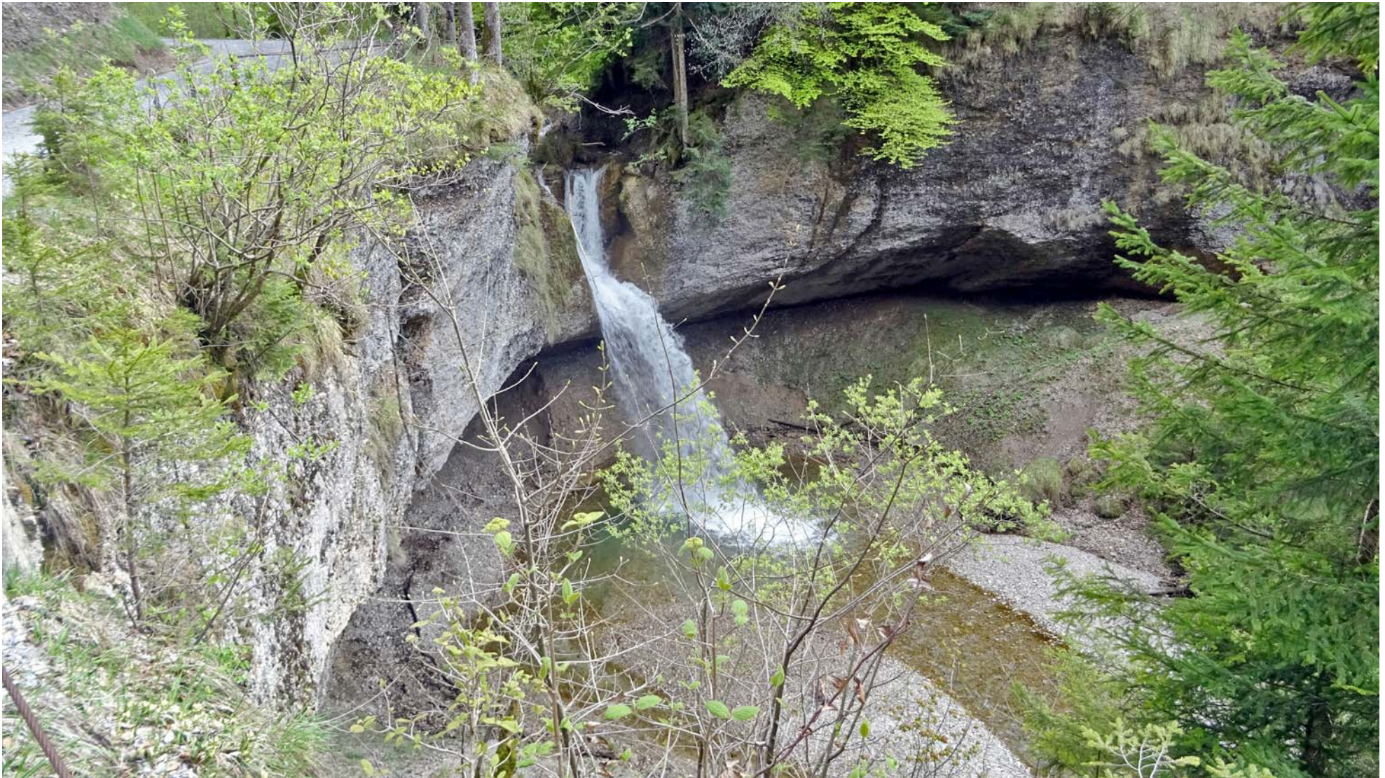
Der dominante Wasserfall ca. auf halber Strecke zwischen O'Rüti und der Tössscheidi

Das absolute Highlight auf diesem Wegstück ist jedoch „er“: