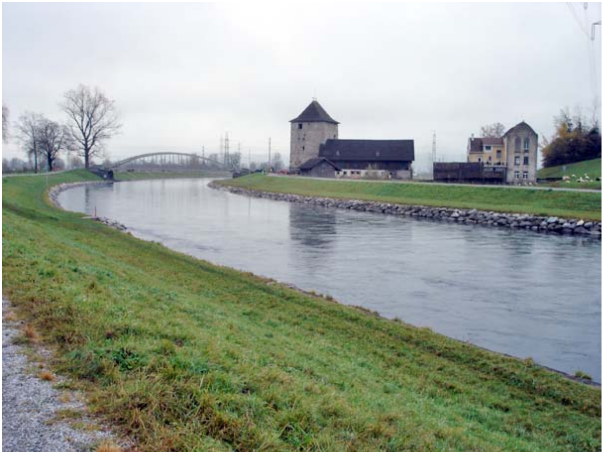
Schloss Grinau am Linth-Kanal