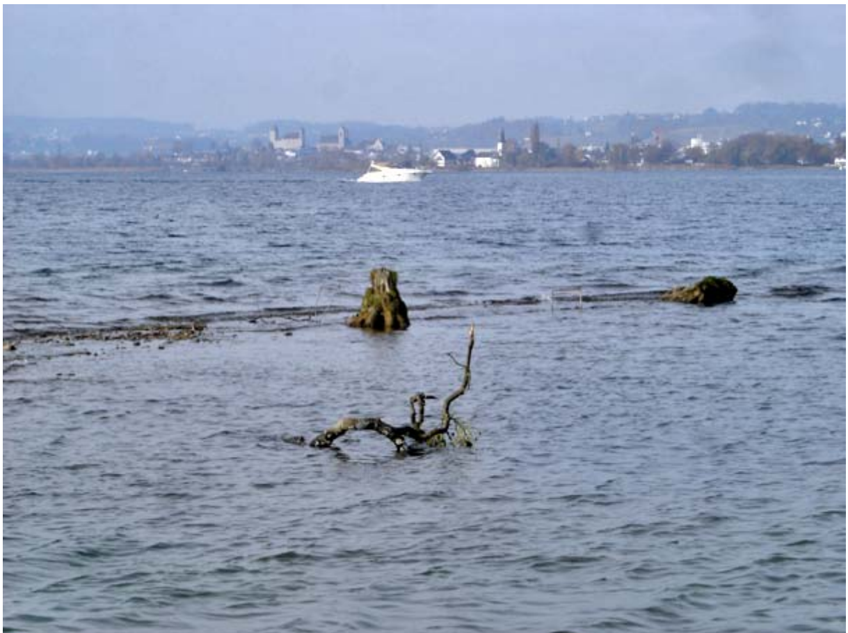
Gezoomter Blick auf Schloss Rapperswil vom Delta der Wägitaler Aa