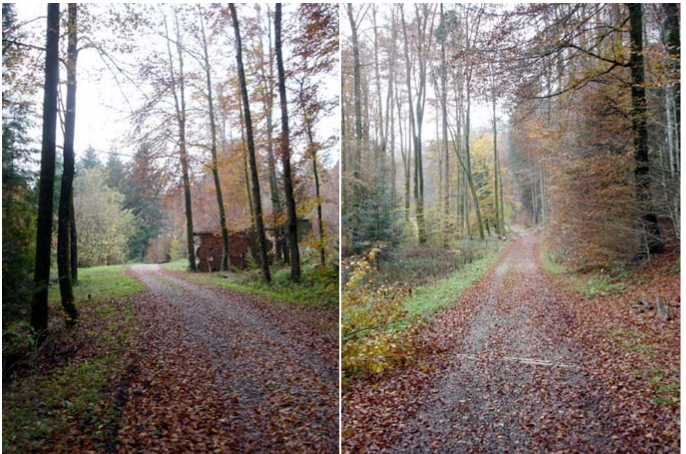
Waldwege auf dem Buechberg