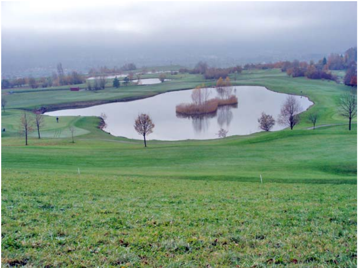
Seen im Golfplatz Bubental