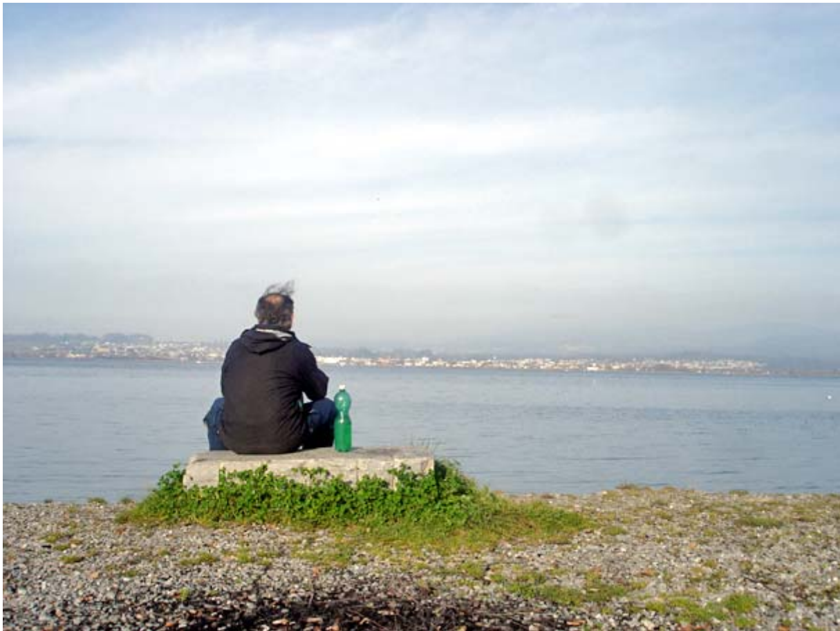
Fast vergessen: 3 x auch eine Pause gemacht: Hier in Altendorf mit Blick zum Start- & Zielort

Diese Wanderung habe ich einerseits als Rekognoszierung unternommen, weil wir sie zwei Tage später mit einer 10-köpfigen Gruppe in umgekehrter Route begehen wollen. Andererseits wollte ich in einem persönlichen Test meinen Fitness-Stand überprüfen. Mein Ziel, die ganze Strecke mit einem Durchschnitt von 6 km/h zu absolvieren, habe ich um 10 Minuten verpasst, doch bis zum nächsten Rigimarsch geht's ja noch ein halbes Jahr ;-)