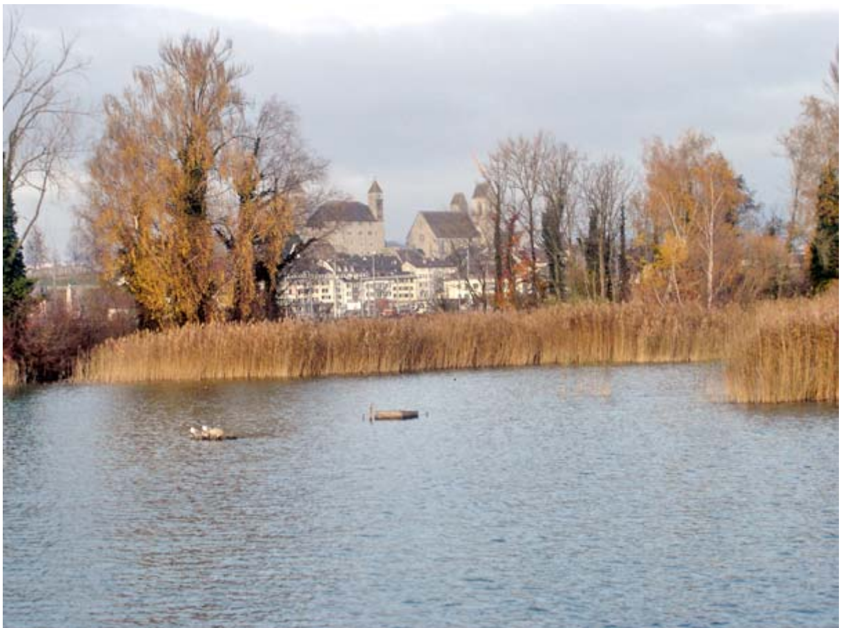
Blick vom Steg auf Schloss Rapperswil