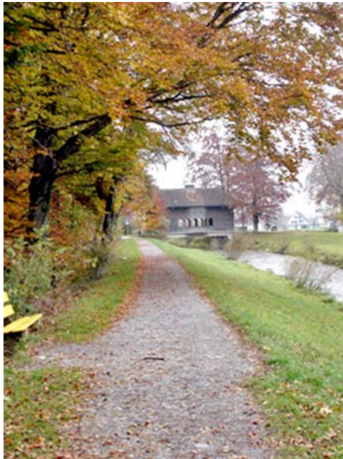
Aabachbrücke bei Schmerikon