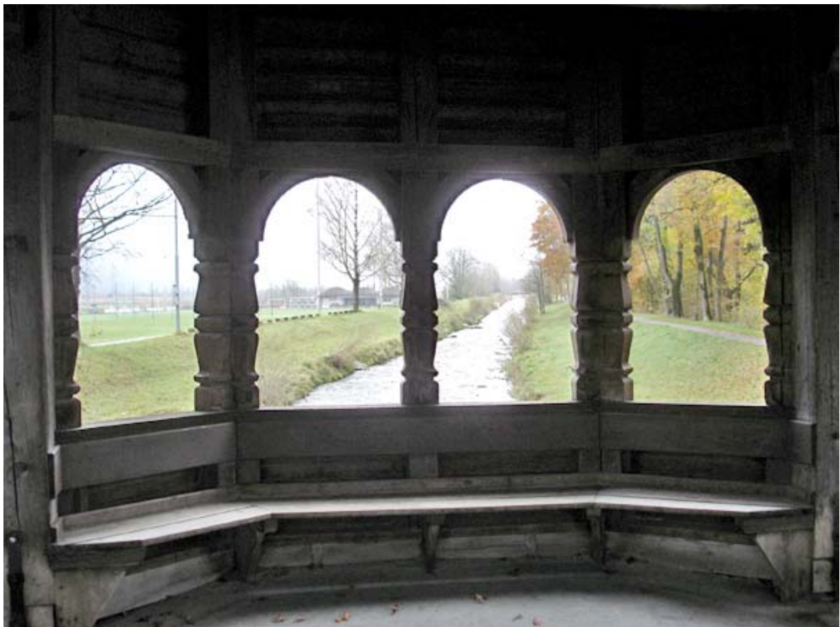
Blick aus der Aabachbrücke