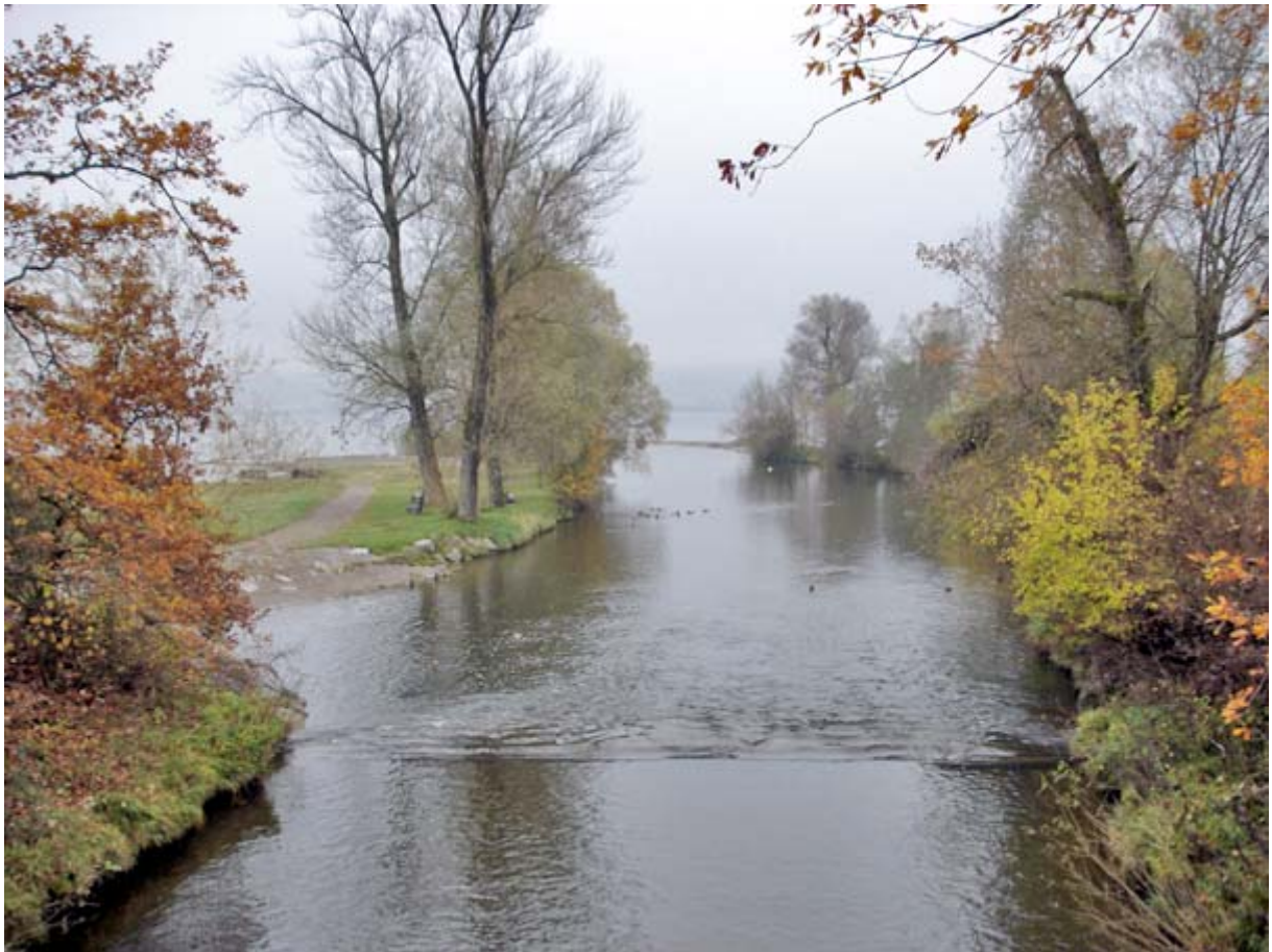
Mündung der Jona in den Obersee