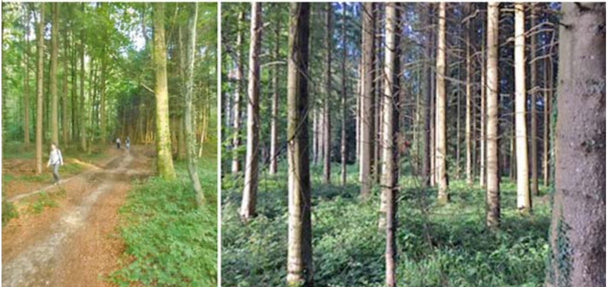
Wunderschöne Waldpassagen im Abendlicht