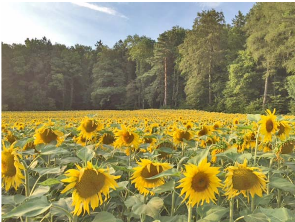
Auch dieses Foto ist von Erik: Sonnenblumen lachen uns an, bevor es den Altberg hoch geht