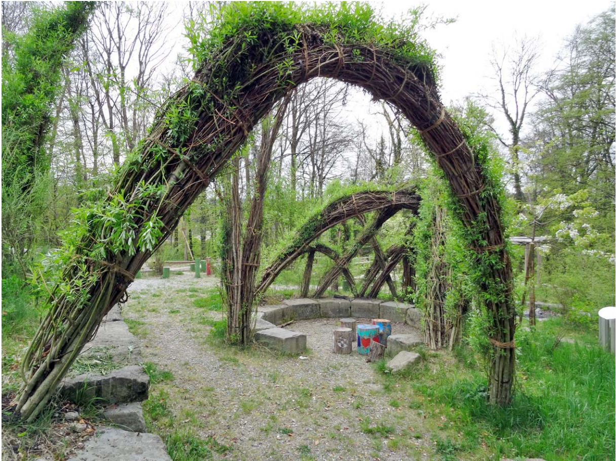
Fantasievoll angelegter Park mit eigenwilliger „Flora-Bändigung“

...exotisch anmutenden Spielplatz in Schulhausnähe: